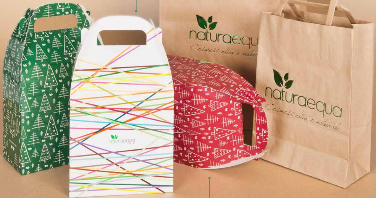
SCATOLA REGALO ROSSA